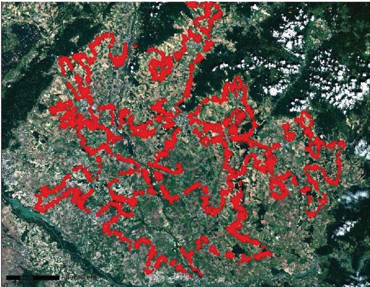
Trénovacie plochy krajiny pokrývky z roku 2016. Satelitná snímka Sentinel 2 z 31.8.2016.