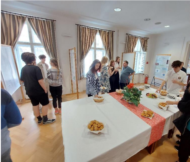
Posterová diskusia spojená s občerstvením